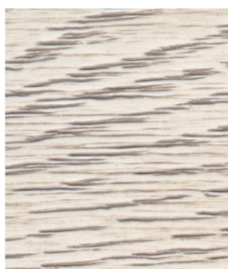
Beż PR-104 (pod Patynę nałożono lakier Solak NC Biel 2143520)