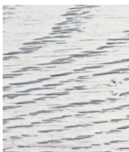
Popiel PR-160/12 (pod Patynę nałożono lakier Solak NC Biel 2143520)