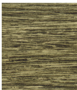
Złota PR-304 (pod Patynę nałożono Bejcę Pastelową Wenge BPA-D09)