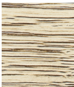
Brąz PR-105 (pod Patynę nałożono lakier Solak NC Biel 2143520)