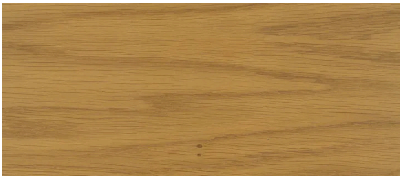
3065 Bezbarwny, Półmat