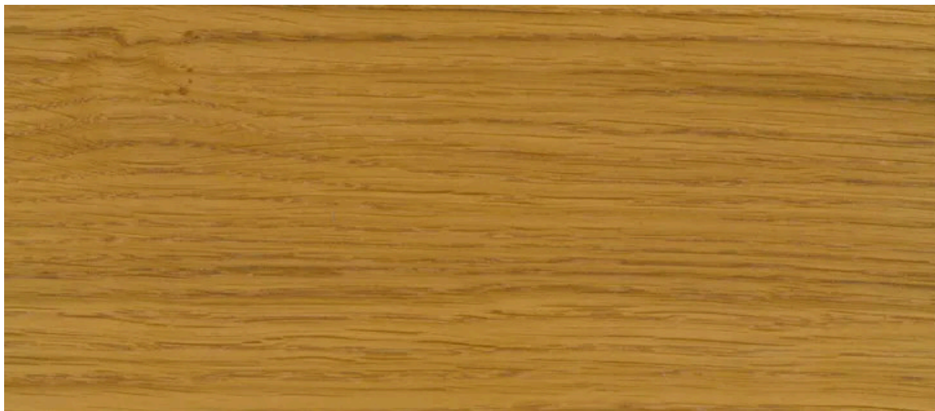
3011 Bezbarwny, Połysk