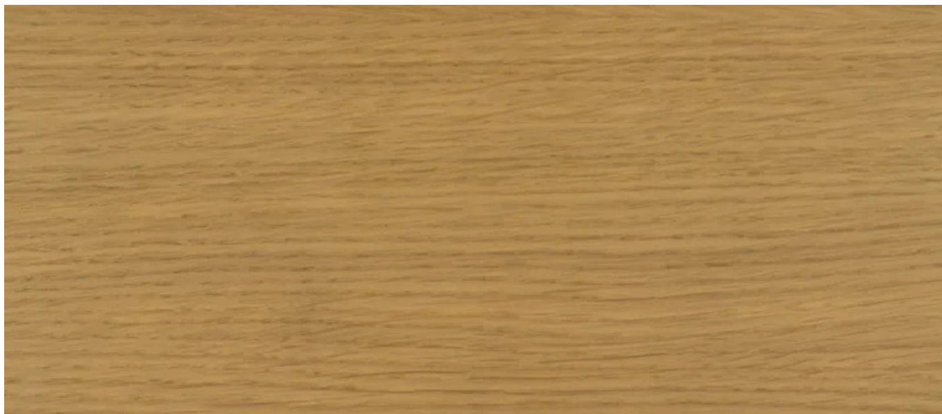
3062 Bezbarwny, Matowy